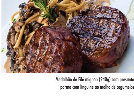
Medalhão de Filé mignon (240g) com presunto parma com lingüine ao molho de cogumelos

Lombo suíno ao vinho tinto com polenta cremosa e agrião 48