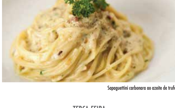
Spaguetini carbonara ao azeite de trufa

Spaguetini carbonara ao azeite de trufa St Peter com ao molho de alcáçarra, amêndoas e passas com purê de batata Picadinho, arroz, feijão preto, couve e farofa de banana Galeto com mini legumes assados