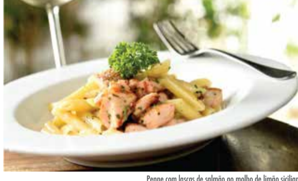
Penne com lascas de salmão ao molho de limão siciliano