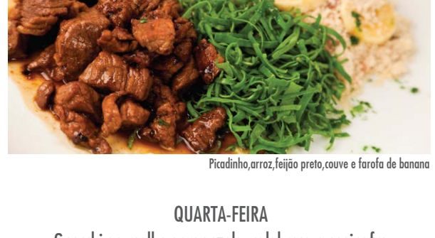
Picadinho, arroz, feijão preto, couve e farofa de banana