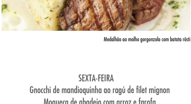
Medalhão ao molho gorgonzola com batata rösti