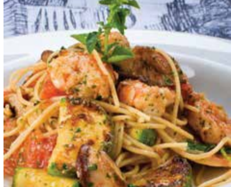
Spaghetini com legumes, shiitake, abobrinha e tomates frescos

Salmão com pupunha, aspargos, abóbora e tomate assados com redução de balsâmico e mel 59