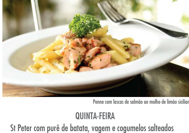
Penne com lascas de salmão ao molho de limão siciliano