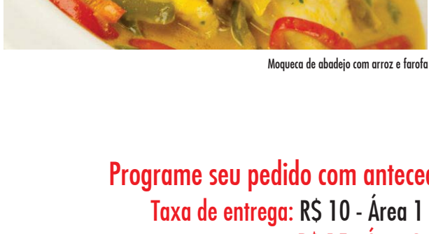
Maqueca de abadejo com arroz e farofa