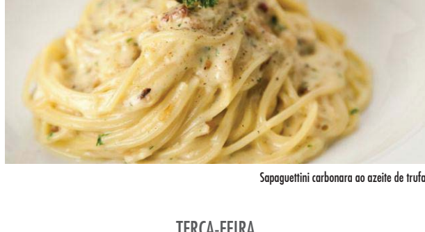
Spaguetini carbonara ao azeite de trufa