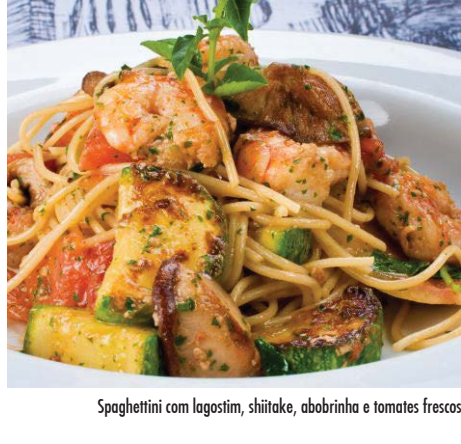
Spaghetini com legostim, shiitake, abobrinha e tomates frescos

Salmão com pupunha, aspargos, abóbora e tomate assados com redução de balsâmico e mel 59