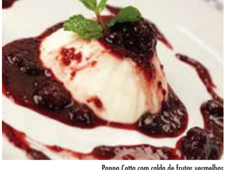
Panna Cotta com calda de frutas vermelhas