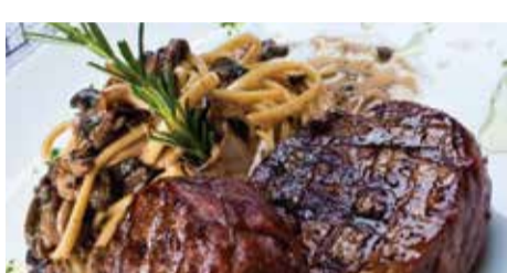
Medalhão de Filé mignon (240g) com presunto parma com linguine ao molho de cogumelos

Lombo suíno ao vinho tinto com polenta cremosa e agrião 48