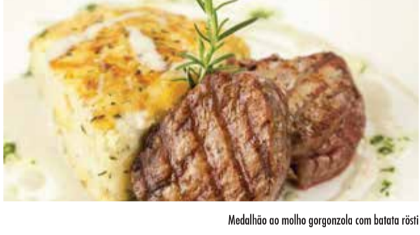
Medalhão ao molho gorgonzola com batata rösti

St Peter com purê de batata, vagem e cogumelos salteados Galeto assado com feijão franco e abóbora Risoto de beterraba com queijo de cabra Medalhão ao molho gorgonzola com batata rösti