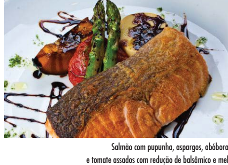
Salmão com pupunha, aspargos, abóbora e tomate assados com redução de balsâmico e mel

Filé a milanesa com risoto de limão siciliano 56