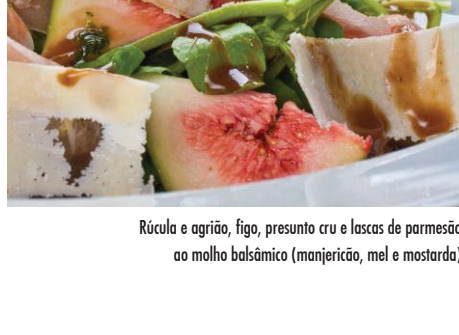
Rúcula e agrião, figo, presunto cru e lascas de parmesão ao molho balsâmico (manjericao, mel e mostarda)

Quiche do dia e mix de folhas ao molho de mostarda e mel 42