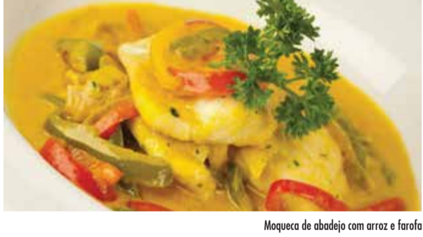
Maqueca de abadejo com arroz e farofa

Gnocchi de mandioquinha ao ragu de filet mignon Maqueca de abadejo com arroz e farofa Bife a milanese com purê e rúcula Couscous marroquino de cordeiro, frango e legumes