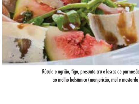
Rúcula e agrião, figo, presunto cru e lascas de parmesão ao molho balsâmico (manjericao, mel e mostarda)

Quiche do dia e mix de folhas ao molho de mostarda e mel 42