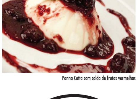
Panna Cotta com calda de frutas vermelhas