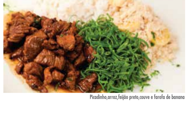
Picadinho, arroz, feijão preto, couve e farofa de banana

Frango ao curry com arroz de grãos Boeuf Bourgignon com Purê de batata Arroz de bacalhau com azeitonas pretas, vagem, ovos e tomate cereja Fettuccine ao ragu de cordeiro