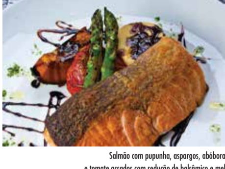
Salmão com pupunha, aspargos, abóbora e tomate assados com redução de balsâmico e mel

Filé a milanese com risoto de limão siciliano 56